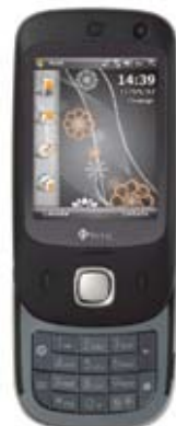
HTC Touch Dual

zakresy 900/1800/1900, Bluetooth, aparat 2 Mpix + VGA, odtwarzacz MP3, AAC, WMA, WAV + wideo, dodatkowo współpraca z E-mail BOX