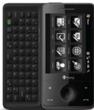
HTC Touch Pro

zakresy 900/1800/1900, WiFi, Bluetooth, GPS, aparat 3,2 Mpix + VGA, odtwarzacz MP3, AMR (dyktafon), AAC, AAC+, WMA, WAV i wideo, dodatkowo współpraca z E-mail BOX