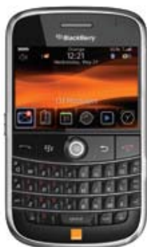
BlackBerry Bold 9000

zakresy 850/900/1800/1900 WCDMA 2100, WiFi, Bluetooth, GPS, aparat 2 Mpix, odtwarzacz MP3, AAC, WMA, WAV i wideo, dodatkowo współpraca z E-mail BOX