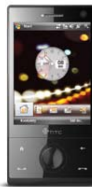
HTC Touch Diamond

zakresy 900/1800/1900, WiFi, Bluetooth, GPS, aparat 3.2 Mpix + VGA, odtwarzacz MP3 i wideo, dodatkowo współpraca z E-mail BOX